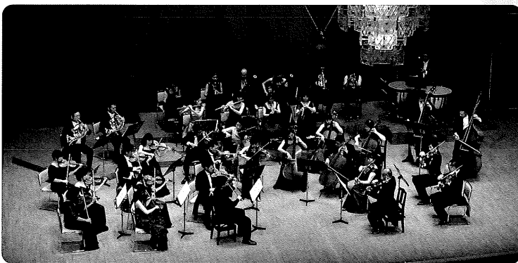
演奏 長崎 OMURA 室内合奏団

シーハットおむらを拠点に県内在住及び出身演奏家などを中心に03年結成。迫昭嘉を音楽監督として始動。09年より松原勝也を迎える。韓国大邱市公演や世界的ソリストと共演も多い。15年東京公演、18年福岡公演。第25回長崎県地域文化章、シーハットおむらの平成22年度地域創造大賞受賞に寄与。14年県民表彰、15年第2回JASRAC音楽文化賞。19年日本オーケストラ連盟準会員加盟。