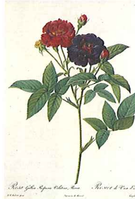
『バラ図譜』より 《ロサ・ガリカ・ブルブレ・アウエルティナー・バルウア》