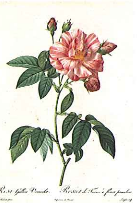
『バラ図譜』より 《ロサ・ガリカ・ウエルシコロム・ロサ・ムンディ》